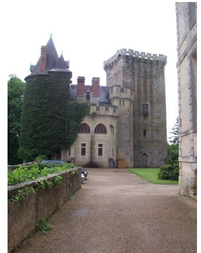
Vieux château de Saint-Loup-Lamairé et sa tour maîtresse Source : Wikipédia (sans modification) Auteur : Carter79 (travail personnel)

Situé au bord du Thouet, cet ancien village de tanneurs et de drapiers, jadis prospère, conserve un charme particulier avec de belles maisons à pans de bois du XV e et XVI e . Nous poursuivrons par la visite des pièces d'apparat du château XVII e , classé Monument Historique, du jardin XVIII e , de l'orangerie qui abrite des collections d'agrumes, pavillon du canal, le tout dans une ambiance onirique qui a inspiré Charles Perrault pour « le comte du chat botté ».