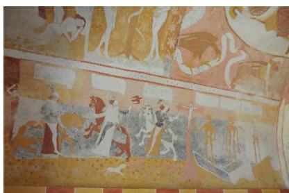
La rencontre des trois morts et des trois vifs Chapelle de Jouhet

Geneviève Desprez et Dominique Sylvain vous proposent :