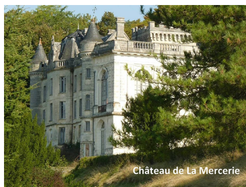
Château de La Mercerie

Les frères Rhétoré se sont ruinés en travaux dans le château néogothique initial (chambres aux décors incroyables de tableaux et de boiseries), et surtout en voulant en faire « un Versailles charentais » par l'adjonction d'une façade de 220m de long. A l'intérieur une collection exceptionnelle d'azulejos, la plus importante de France et même d'Europe, en dehors de celle du Portugal.