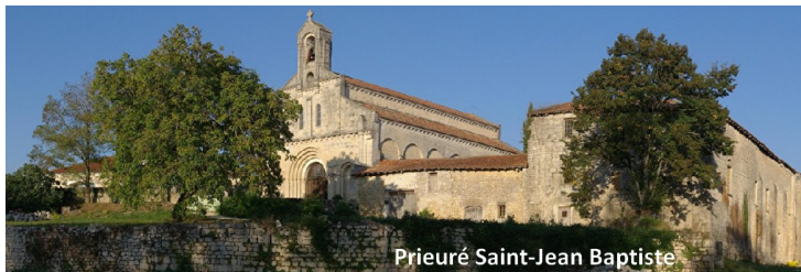
Priuré Saint-Jean Baptiste