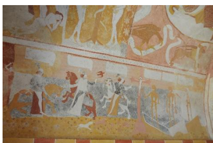
La rencontre des trois morts et des trois vifs Chapelle de Jouhet

Geneviève Desprez et Dominique Sylvain vous proposent :